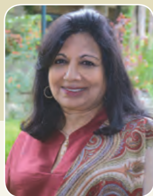
Dr. Kiran Mazumdar-Shaw